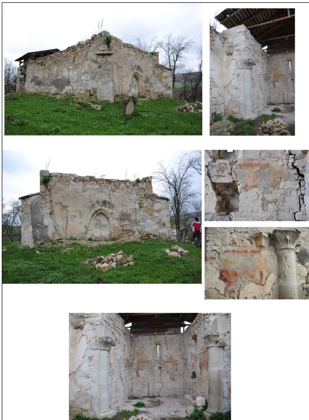
Pl. 4. Biserica arpadiană de la Nima.