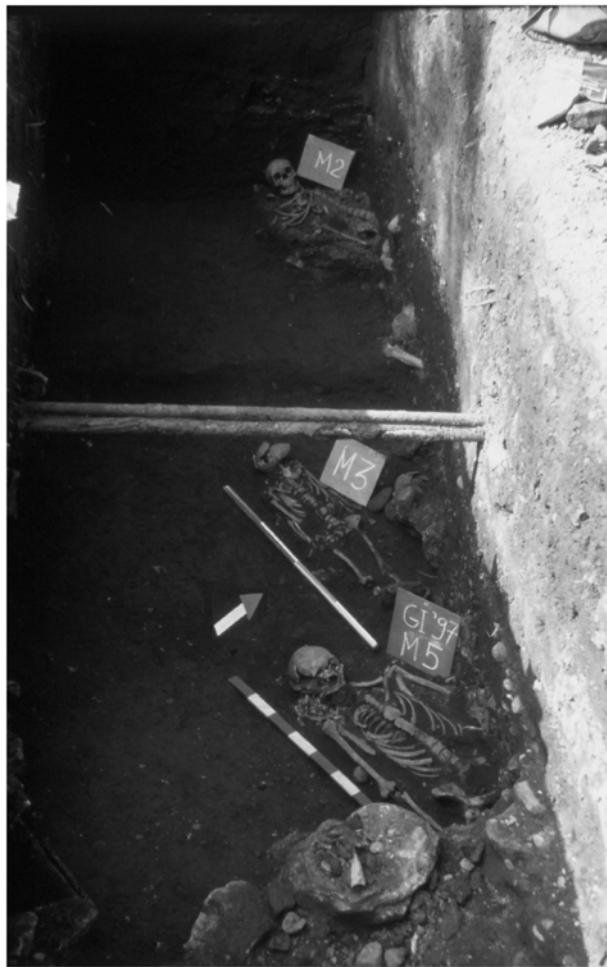
Mormintele 2, 3 și 5