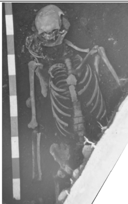
Mormintele 3 și 5