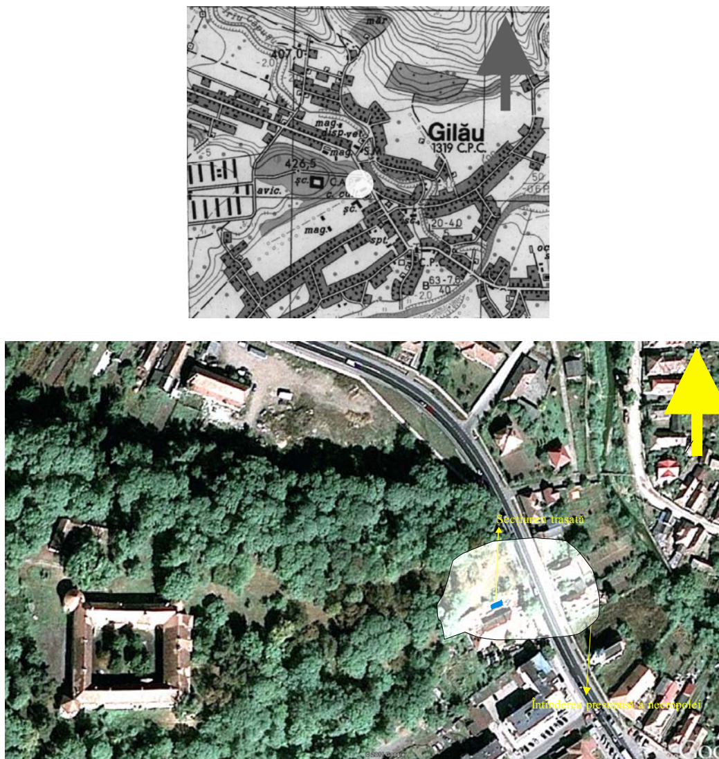
Fig. 1–2. Poziția topografică a cimitirului de la Gilău. Fotografie aeriană și locul cimitirului (Google map).

Sondajul a constatat dintr-o secțiune de 6 \times 1,50 m, orientată ENE–VSV, la aproximativ 1 m de bazinul săpat în decembrie 1996 și la 3 m de zidul clădirii unde a funcționat discoteca (clădire de secol XVIII) (Fig. 2). Până la -1,40 – -1,50 m, sondajul a evidențiat un pământ amestecat, rezultat din răvășiri medievale și moderne, în care au apărut fragmente ceramice medievale, romane și câteva preistorice, de tip Tiszapolgár , bolovani gălbui de carieră și fragmente de cuie și obiecte de fier atipice. În poziție secundară a apărut și un fragment dintr-un mortarium roman din piatră. Numeroase fragmente de oase umane deranjate au ieșit la iveală începând cu adâncimea de 1,60 – 1,70 m, prefigurând existența unor schelete, care se aflau în jurul adâncimii de -1,90 m. Din documentația sumară mai reiese că în secțiune au fost descoperite câteva cuie apărute în apropierea scheletelor.