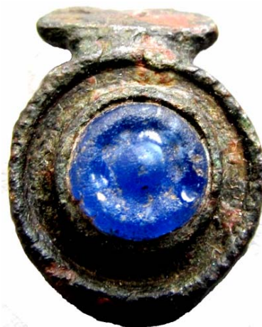
Fig. 3. Inel digital cu cabochon.

D verigii: 0,2 cm; G: 1,42 gr (Pl. 3. 2.); 2. inel de buclă din bronz, cu capătul în formă de „S” , descoperit pe tâmpla stângă. D: 2,1 cm; H: 2,6 cm; l. capătului în S: 0,5 cm; D verigii: 0,1 cm; G: 0,91 gr (Pl. 3. 1.); 3. inel digital din bronz cu cabochon cu o piatră albastră, păstrat fragmentar ; D chatonului: 1,3 cm; D lăcaşului: 0,7 cm; l. verigii: 1 cm; G: 1,60 gr (Pl. 3. 3; Fig. 3); 4. monedă de bronz din groapa scheletului . D: 2,2 cm; G: 1,09 gr; Huszár nr. 73 4 (Pl. 3. 4.); Secolul XII.